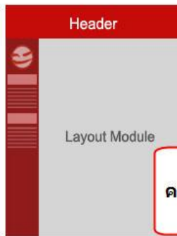
รูปแบบโครงสร้างเฟรมทางซ้าย