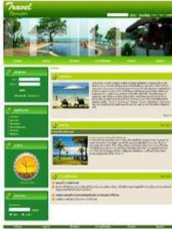
รูปแบบเทมเพลต : travel_001